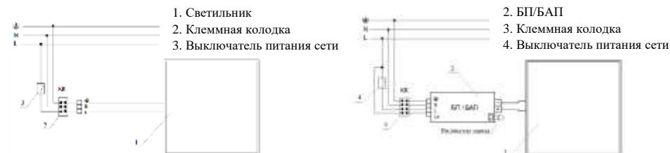
Рис. №3 Схема подключения светильника.