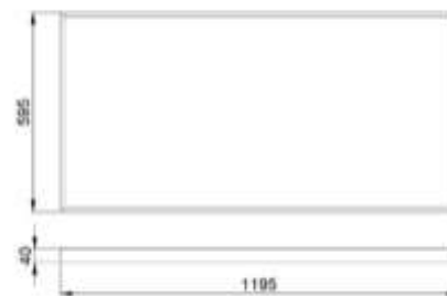
Рис.№1 Размеры светильника