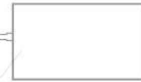
Рис. №3 Схема подключения светильника.