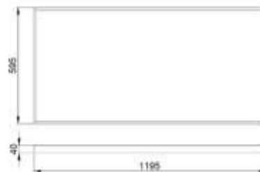
Рис.№1 Размеры светильника