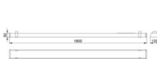
Рис.№1 Размеры светильника