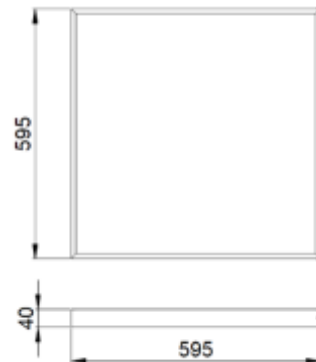
Рис.№1 Размеры светильника