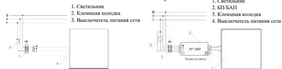
Рис. №3 Схема подключения светильника

5.3. Установите светильник в соответствии с типом крепления.