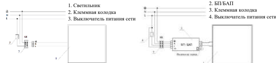
Рис. №3 Схема подключения светильника.