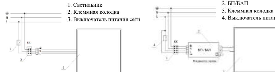
Рис. №3 Схема подключения светильника