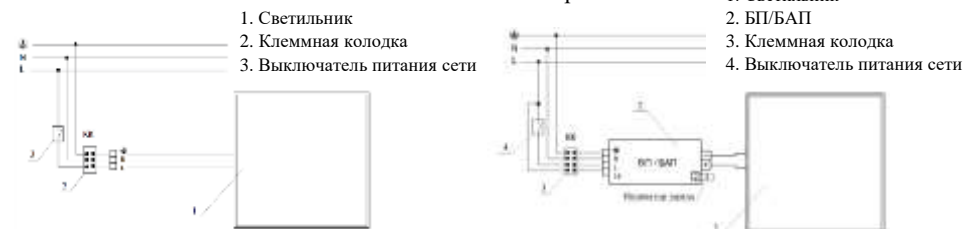
Рис. №3 Схема подключения светильника.