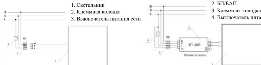
Рис. №3 Схема подключения светильника.