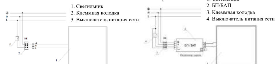
Рис. №3 Схема подключения светильника.