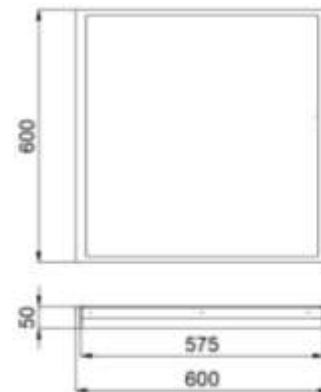
Рис.№1 Размеры светильника

1.5. Вид климатического исполнения УХЛ4 по ГОСТ 15150-69.