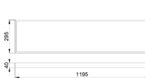
Рис.№1 Размеры светильника