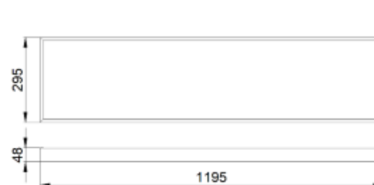
Рис.№1 Размеры светильника

1.5. Вид климатического исполнения УХЛ4 по ГОСТ 15150-69.