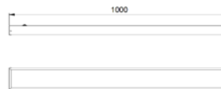
Рис.№1 Размеры светильника

1.5. Вид климатического исполнения УХЛ4 по ГОСТ 15150-69.