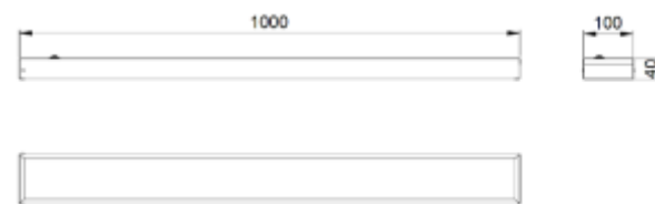
Рис.№1 Размеры светильника