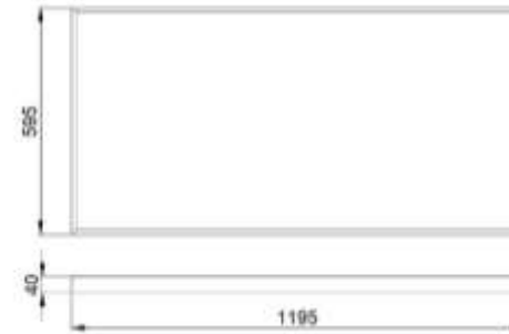
Рис.№1 Размеры светильника