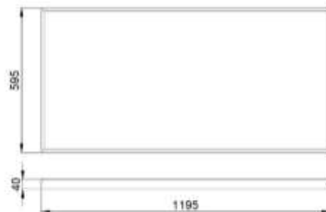
Рис.№1 Размеры светильника