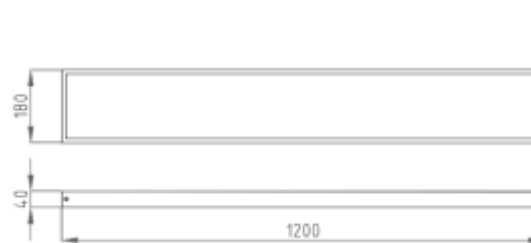
Рис.№1 Размеры светильника

1.5. Вид климатического исполнения УХЛ4 по ГОСТ 15150-69.