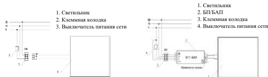
Рис. №3 Схема подключения светильника.

5.3. Установите светильник в соответствии с типом крепления.