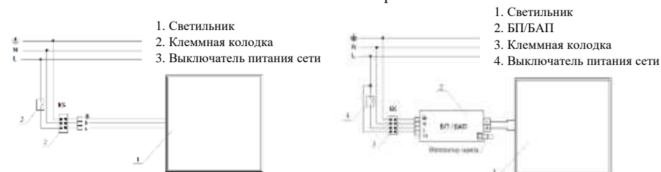
Рис. №3 Схема подключения светильника.

5.3. Установите светильник в соответствии с типом крепления.