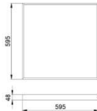
Рис.№1 Размеры светильника