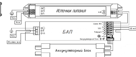
Рис. №5 Схема подключения светильника к сети питания напряжения.

N- ноль ( синий) Земля ( Желто-зеленый) L- Фаза( Белый/ коричневый)